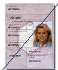
Passeport ancien modèle